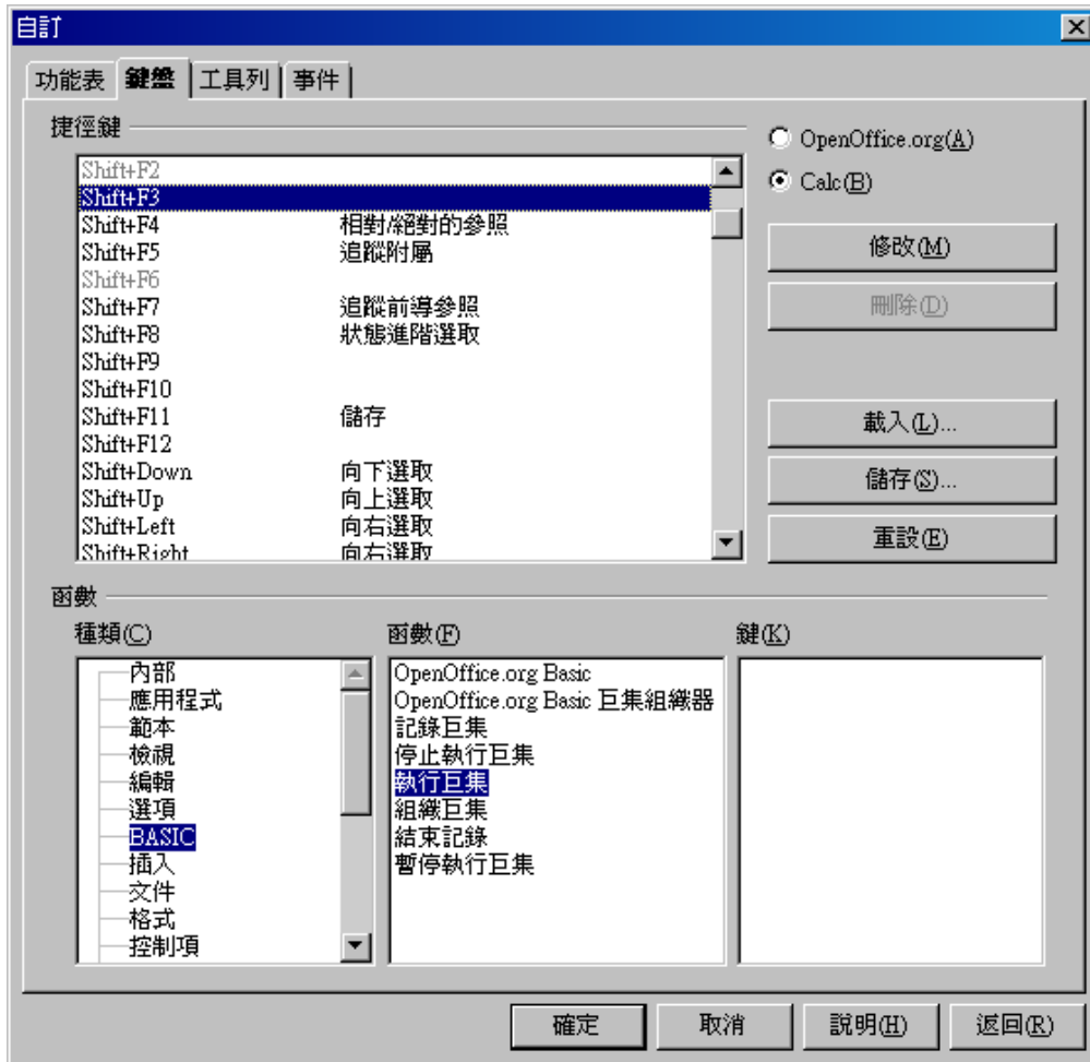
圖 3: 選擇欲指定之快捷鍵